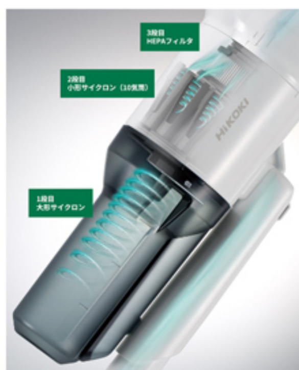
2段サイクロン拡大

■2段サイクロン+高性能 (HEPA) フィルタ※3を搭載しました (特許出願中)。