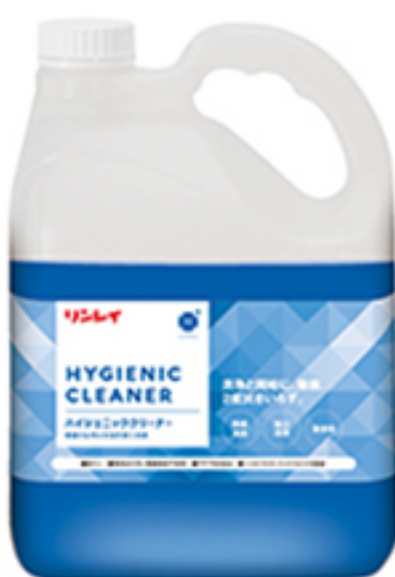
ハイジエニック クリーナー-4ℓ