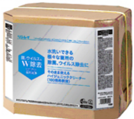
そのまま使えるハイジエニッククリーナー-18ℓ