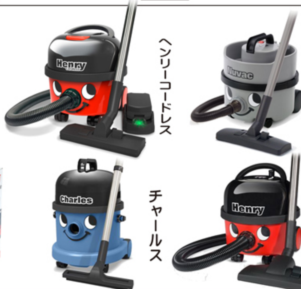
HEPA仕様ダストバック