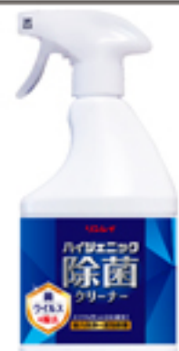
ハイジエニック除菌クリーナー-450 ml